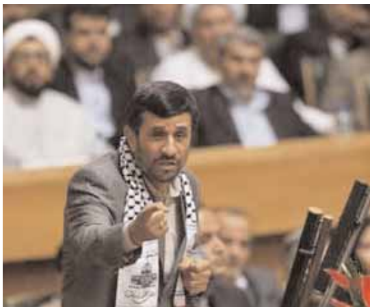
«Να οδηγηθούν στη Δικαιοσύνη οι Ισραηλινοί "εγκληματίες πολέμου"» λέει ο Αχμαντιντζάντ

Η Τεχεράνη δήλωσε την Τετάρτη «έτοιμη για έναν εποικοδομητικό διάλογο» με τις μεγάλες δυνάμεις για το πυρηνικό του προγράμμα, αλλά επιμένει στη συνέχιση των πυρηνικών δραστηριοτήτων του, όπως αναφέρει ανακοίνωση που εκδόθηκε από το γραφείο του γραμματέα του ανωτάτου ιρανικού